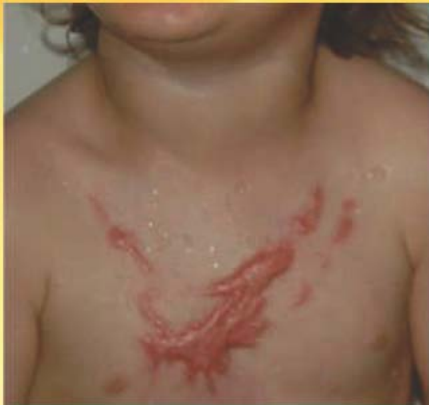
A kezelés előtt