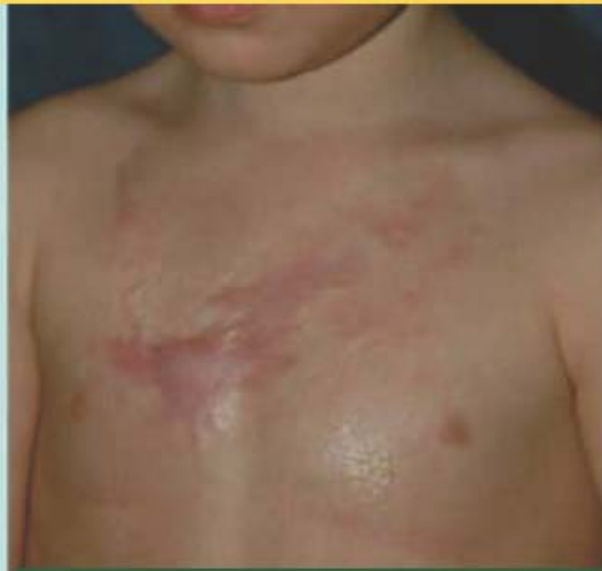
Öt hónappal a kezelés után